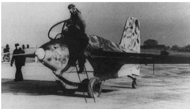
Abbildung 7 Messerschmitt Me163

Sander RAK.1 erreichte dabei eine Höhe von 20 bis 30 Metern und legte in 80 Sekunden knapp zwei Kilometer zurück. Es kam allerdings zu einer Bruchlandung, die Fritz von Opel jedoch unbeschadet überstand. Zu weiteren Raketenversuchen kam es daraufhin nicht mehr.