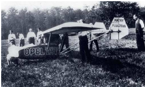
Abbildung 6 Opel-Sanders RAK.1

ging bei der anschließenden Bruchlandung verloren.