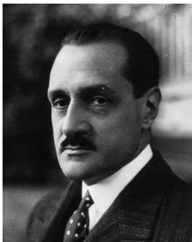
Abbildung 9 Robert Esnault-Pelterie

Robert Esnault-Pelterie, ein Pionier der Französischen Luftfahrt, wandte sich ab dem Jahre 1908 vermehrt der Raketentechnik zu. Robert Esnault-Pelterie grösster Beitrag war im Jahre 1930 die Publikation eines Buches mit dem Titel "L' Astronautique", welches zusammen mit der im Jahre 1934 erschienen Ergänzung, "L' Astronautique-Complement" praktisch alles was zu jener Zeit über Raketentechnik und Raumfahrt bekannt war umfasste.