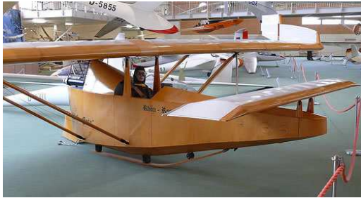
Abbildung 5 Lippisch Ente

Die Entwicklung von Flugzeugen mit Raketenantrieb begann in den späten 30er Jahren in Deutschland. Der deutsche Industrielle und Raketenpionier Fritz von Opel - auch Raketen-Fritz genannt- finanzierte verschieden Projekte mit Raketenantrieb.