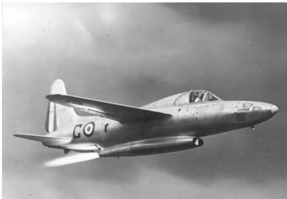
Abbildung 2 SO-6025 Espadon mit SEPR 251

Die Entwicklung der Aggregate stützte sich anfänglich stark auf die aus dem Betrieb von Triebwerken Walter 109-509, dem Antrieb der Messerschmitt Me 163, gewonnenen Erkenntnissen, sowie dem Wissen deutscher Experten.