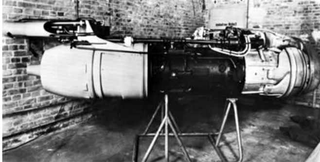
Abbildung 8 BMW Triebwerk 109-003 R

info@mirage-buochs.ch www.mirage-buochs.ch