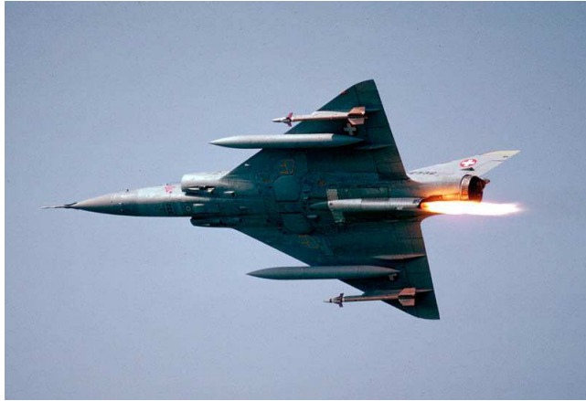
Abbildung 4 Mirage III/S+ mit aktiviertem SEPR 844

Die Raketenmotoren SEPR 841 & SEPR 844 kamen bei 6 Luftwaffen - Frankreich, Spanien, Pakistan, Südafrika, Libyen, Schweiz - zwischen 1961 bis 1990 zum Einsatz. Gesamthaft wurden über 10'000 SEPR-Einsätze geflogen.